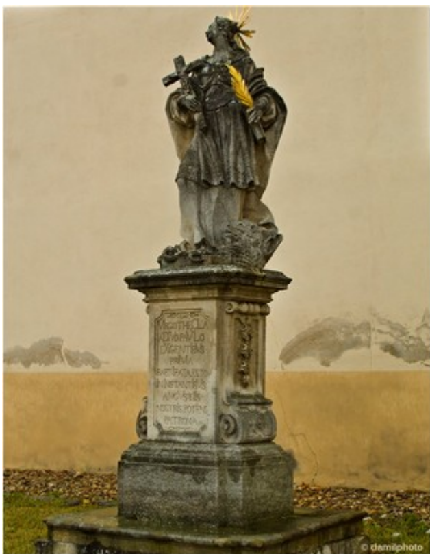
Dole: barokní socha svaté Tekly z roku 1751 v jejichž základech byl křížový kámen nalezen.