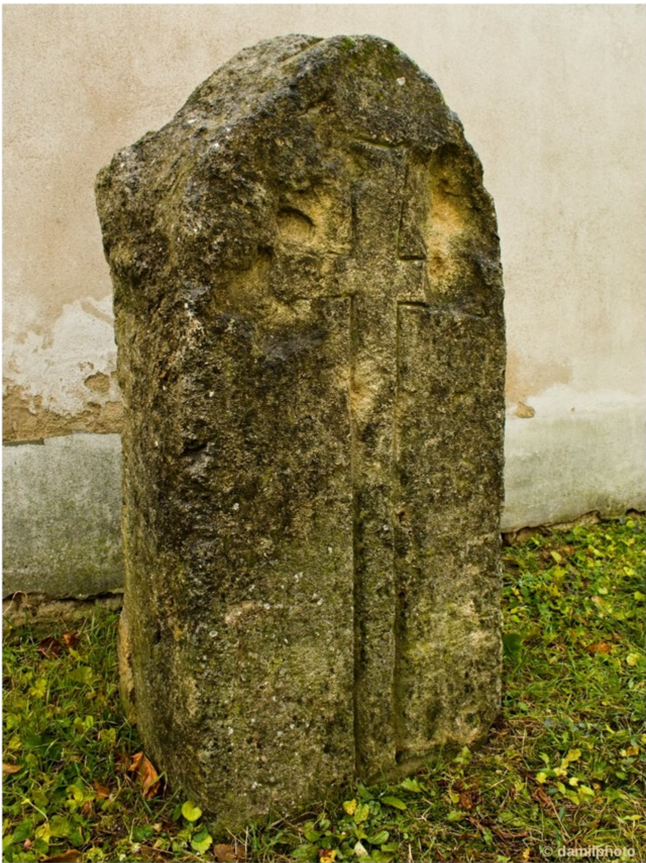
Nahoře: čelní pohled na kterém je dobře patrné novodobé poškození kamene i zřejmě starší miskovitý výtluk nad levým břevnem.