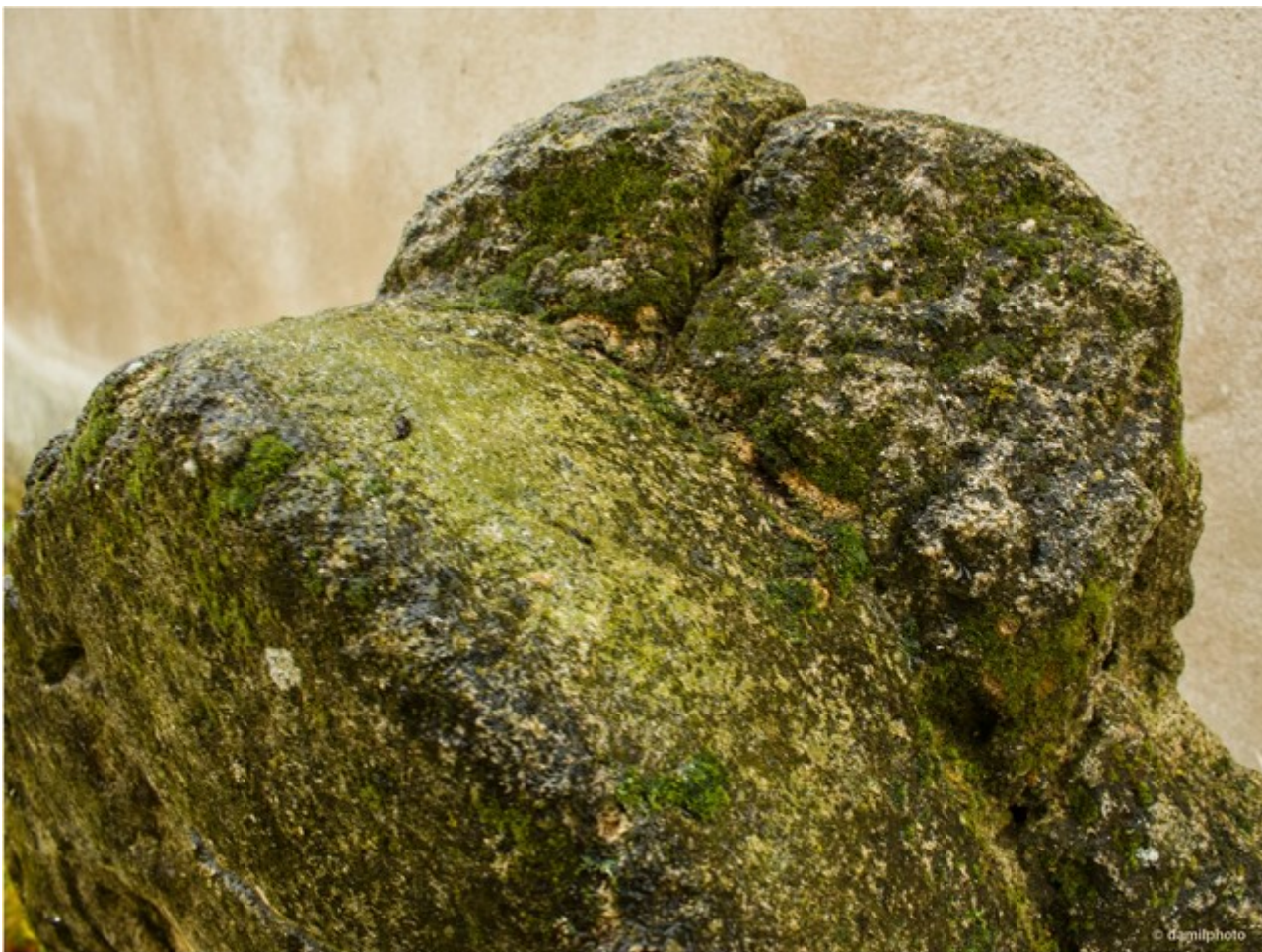
Nahoře: boční pohled, přechod mezi opracovanou přední a neopracovanou zadní částí kamenné desky.