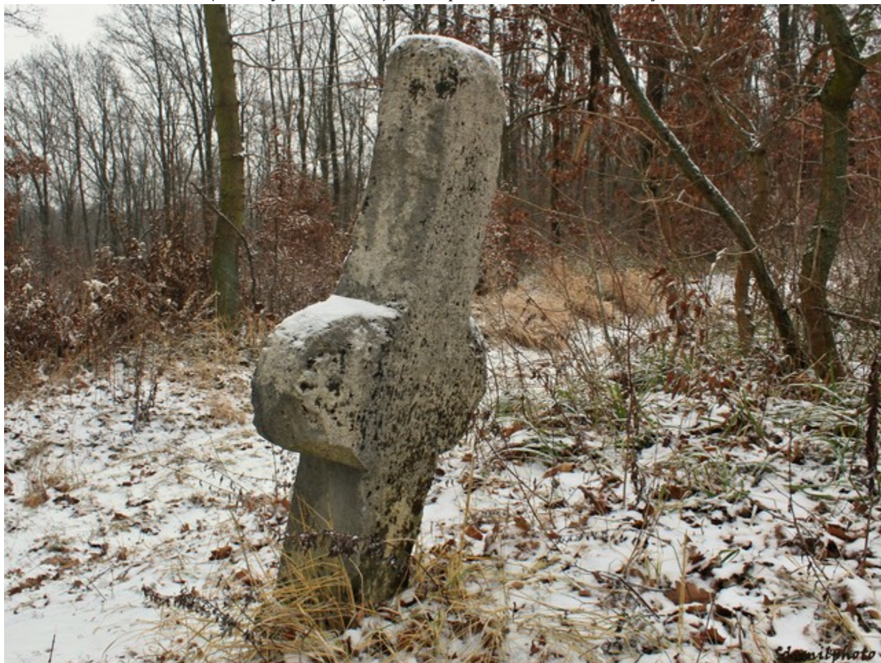
Dole: snímek šikmo odzadu (ze strany českého textu). Mělká prohlubeň na boku naznačuje odlom horního ramene