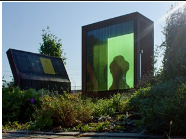
Novodobá replika u kostela P. Marie Královny