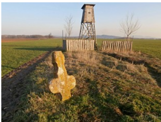
Celková situace v roce 2016