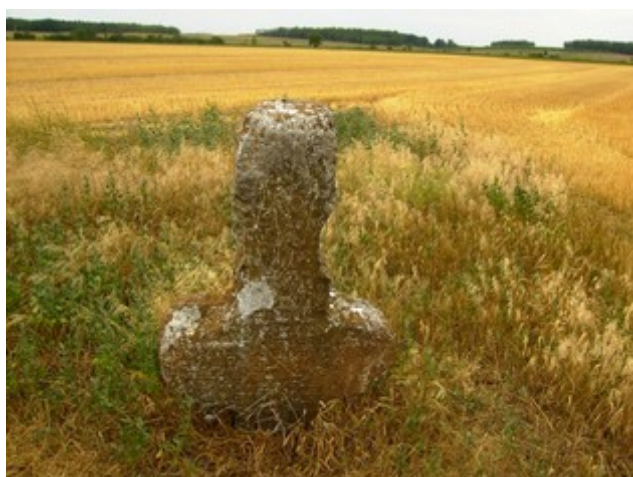
Stav v roce 2017; foto © Iva.Šilbergerová