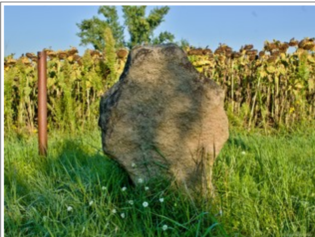
Kámen ze zadní strany