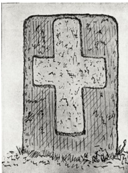
Ilustrace: František Přikryl, 1907

Historie publikování: Kámen uvedl do literatury Fr. Přikryl (1907). Na straně 122 ( Sv. Cyril a Method v památkách starožitných na Moravě a ve Slezsku ) píše k obrázku číslo 51 poznámku: „Borkovany-Za dědinou 2km při silnici k Těšanům pod kopcem Stráž, kde odbočuje nová silnice k Štibořicím.“