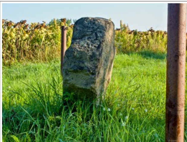
Pohled z pravého boku