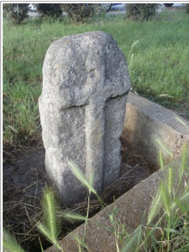
Obrázky: Pavla Smejkalová © 2019