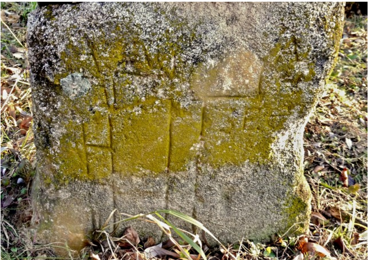
Dole: detail reliéfu na spodním fragmentu