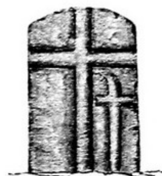
Fig. 30. Lösch.

Zdroje: Do literatury objekt uvedl Alois Franz (1893) pod evid. číslem 36: „...Lösch bei Brünn an der füdlichen Längswand des Kirchen schiffes.“ Viz obrázek vpravo.