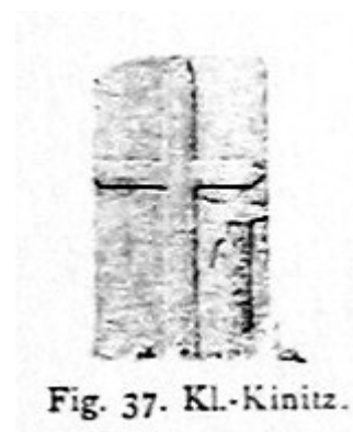
Fig. 37. Kl.-Kninitz.