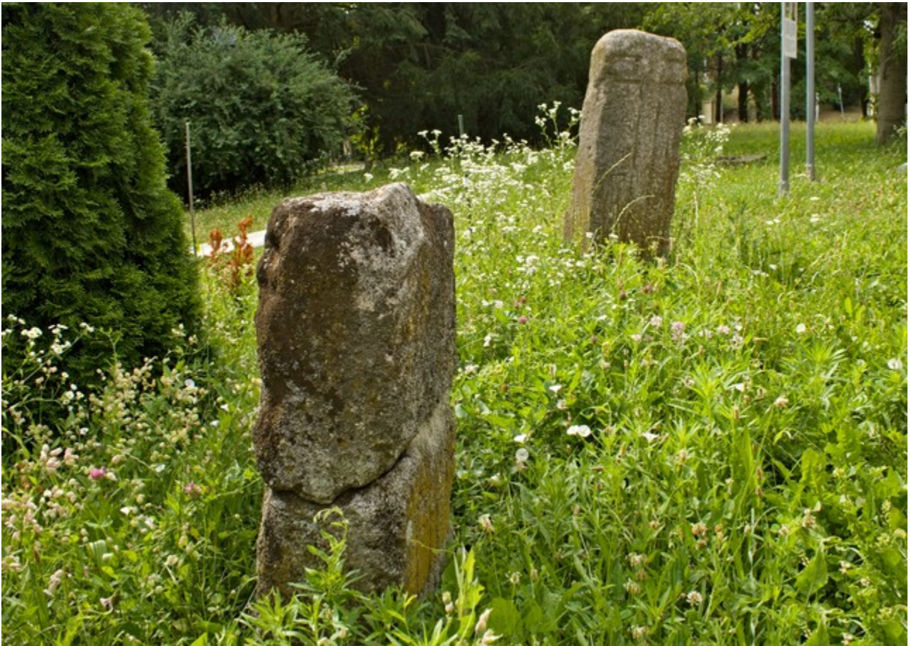
Nahoře: kameny 1280 v popředí a 1281 v pozadí.