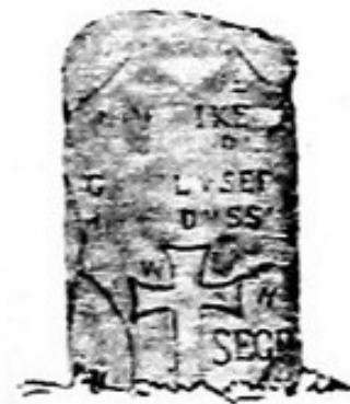
Fig. 38. Bei Brünn.

Poznámka: evidenční list NPÚ z roku 1965 registruje skupinu tří památných kamenů, které se původně nacházely u výše zmíněné pěší cesty a později byly přemístěny do areálu nemocnice. Již tehdy konstatuje, že ze tří kamenů zbyly již pouze dva, dnešní 1280 a 1281. Třetím kamenem je (snad) myšlen zmizelý kámen č. 1283 (Franz: Fig.40). Podrobněji k problému ve formulářích pohřešovaných kamenů číslo 1283 a 1282.