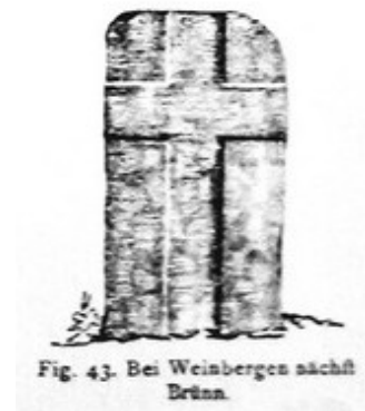
Fig. 43. Bei Weinbergen nächst Brunn.

Ilustrace: vlevo: J Havelka 1885, vpravo: A.Franz 1893