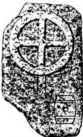
Fig 87 Bihaiowitz.