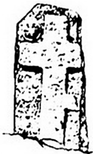
Fig 86 Chlupitz.